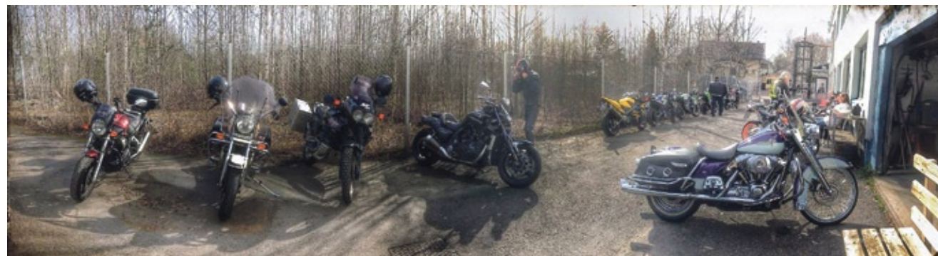
Hieno syksyinen panoraamakuva Torpan pihalta Tapanilasta. Takana näkyvä metsä on ollut vuodesta 2019 alkaen vain muisto: se hakattiin ja naapuriksi saatiin 2000-luvun kummajaisia: rivi talliosakerakennuksia eli miesluolayhdyskuntia. Kuvassa näkyy hyvin Torpan laaja pyöräskala customeista sportteihin ja matkasohvista seikkailupyöriin.