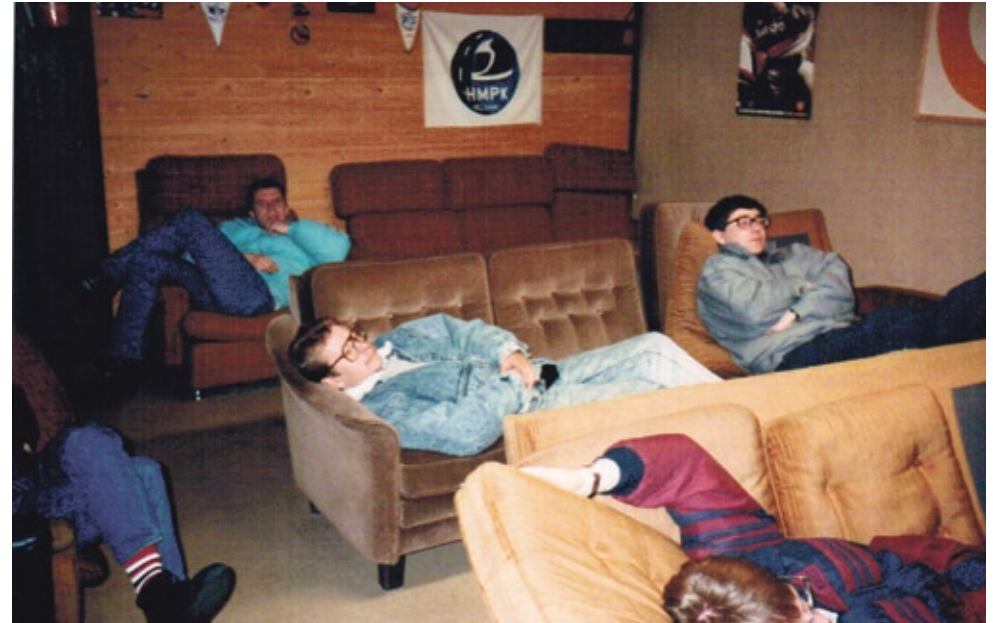
Kovat hovit vaativat perusteellisen levon. Yläkuvassa menossa palauttava jakso Motorpalalla joskus 1980-luvulla. Sohvakalusto on yleensä saatu kerholle käytettynä ja lahjoituksina, joten se on valmiiksi sisäänajettu vaaka-asentoa varten.