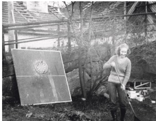
Vasemmalla torppalaisia nauttimassa kesästä luonnon helmassa. Huomaa 1970-luvun lain vaatimukset täyttävä roiskeläppä.