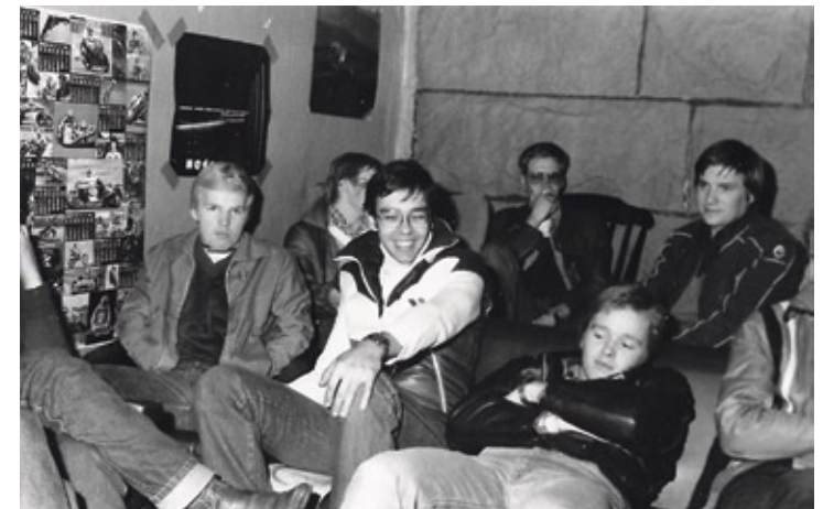
Tässä kuvassa 1980-luvun torppalaisia viettämässä aikaa. Kuva on mahdollisesti TV-huoneesta, jossa katsottiin filmejä projektorin avulla ennen television tuloa. Motorpallahan oli historian aikana oleskelutilan ja huoltohallin lisäksi "punntsitali", pelinurkkaus ja jopa suihkuhuone. Viihtymistä lisäsivät stereot, prätkälehdet, biljardi, pingis ja muut pelit.