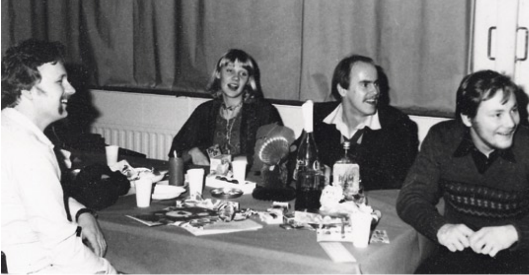
Jälleen yhdet hauskat pikkujouluet menossa. Juhlapaikkana ilmeisesti Nummelan motelli, joka oli suosittu juhlapaikka Rastilan majan ohella. Majan palon 1987 jälkeen vakiintui pikkujoulujen tilalle Läskiäisperinne kevättalvella.