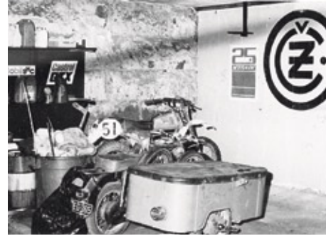
Ylhäällä Motorpan huoltohallin itä-pyöränurkkauksesta otettu kuva. Ajatus itäpyöristä kuitui omaan mahdottomuuteensa 1980-luvulla.