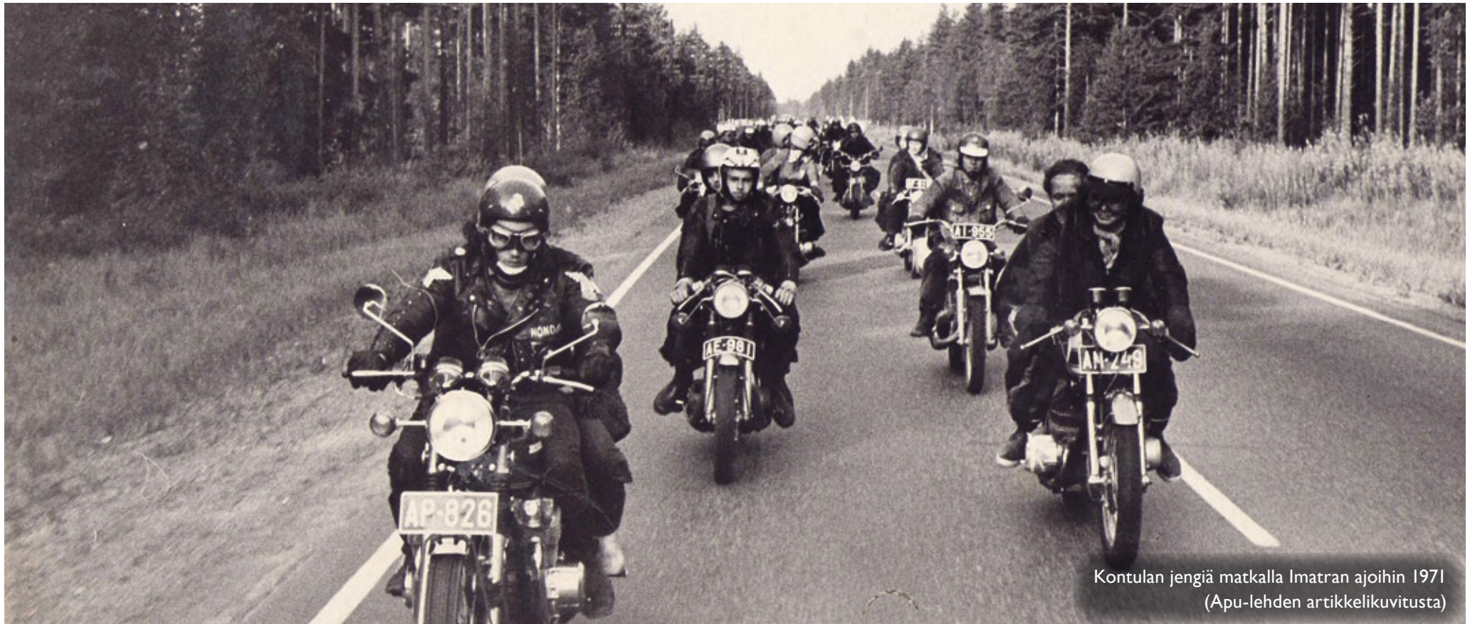
Kontulan jengiä matkalla Imatran ajoihin 1971 (Apu-lehden artikkelikuvitusta)

Keväällä 1973 aloitettiin kunnostustyöt navetalla yhteistyössä kaupungin kanssa ja 12.6.1973 pidettiin avajaiset. Uusi kerhotalo avattiin juhlallisesti nimellä ”Motorppa”, paikalla oli kymmenien motoristien lisäksi kaupungin johtoa, Nuorisoasiainkeskus, nuorisopoliisi ja moottoripyöräpoliiseja. Pelko Helvetin enkeleistä, aseista, huumekaupasta, seksiorgioista ja Sasekan perikadosta osoittautui aiheettomaksi ainakin tässä tapauksessa.