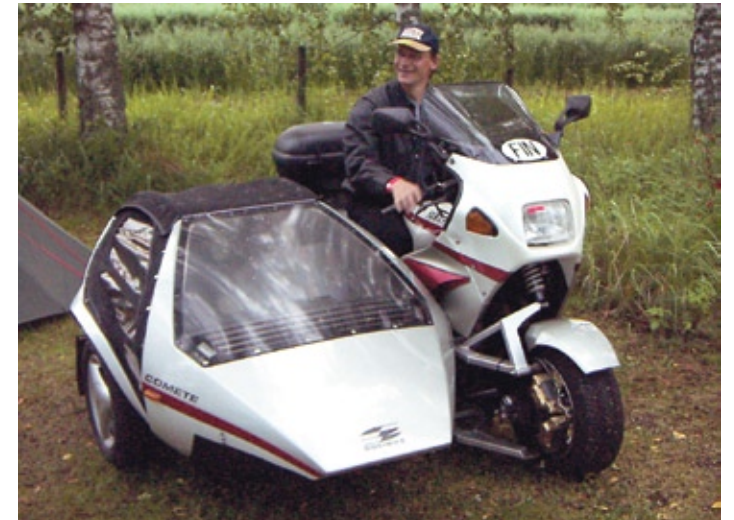
Sivenin Mikan Yamaha FJ-Comete joskus 1990-luvulla. Se ei ollutkaan mikä tahansa lulla, vaan Mikalla taitaa vieläkin olla nimissään sillä tehty sivuvaunupyörien varttimailin kärkiaika Suomessa. Kuva on ilmeisesti Somerolta Ressu-meetingistä.