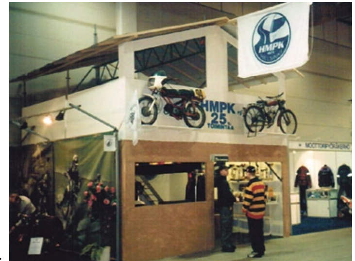
Oikealla 25-juhlavuoden kunniaksi rakennettu Torpan kaksikerroksinen osasto 1998 MP-messuilla.