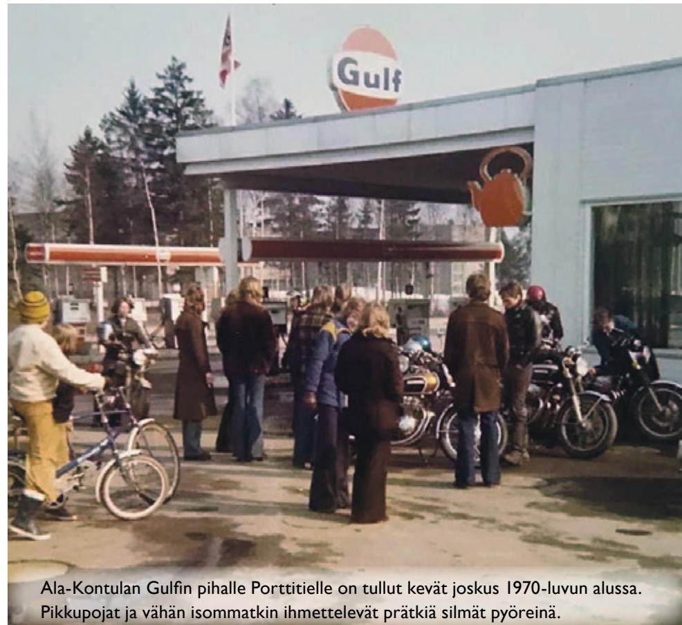
Ala-Kontulan Gulfin pihalle Porttitielle on tullut kevät joskus 1970-luvun alussa. Pikkupojat ja vähän isommatkin ihmettelevät prätkiä silmät pyöreinä.