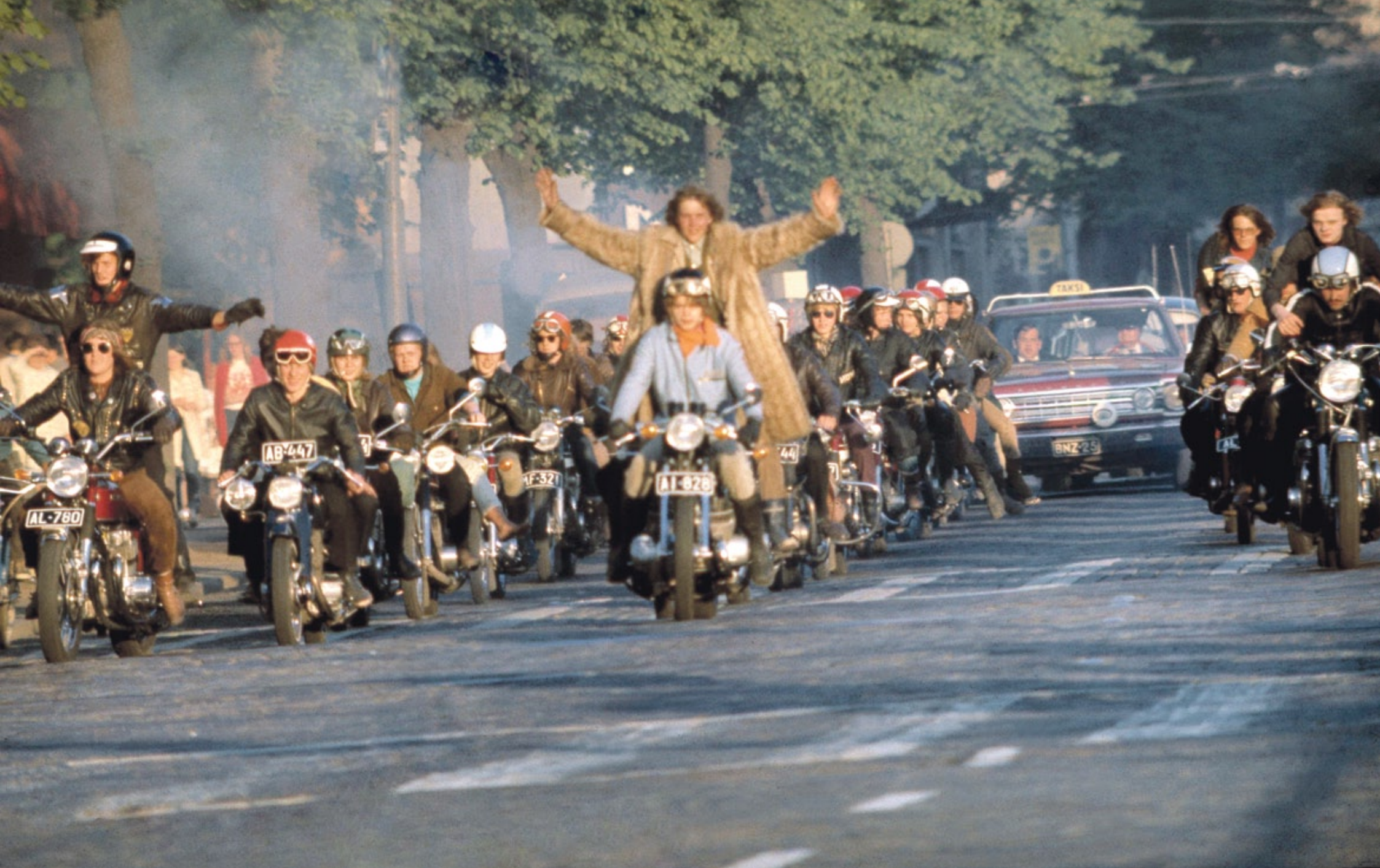
Condomikotkat oli 1970-luvun alun stadilainen löyhä motoristiporukka, joka kokoontui Leppäsuon Shellin ja Autotalon maisemissa ja järjesti näyttäviä yhteisajoja. Myös torppalaisia osallistui kotkien rientoihin. Tämä paraati taitaa olla Mannerheimintieltä.