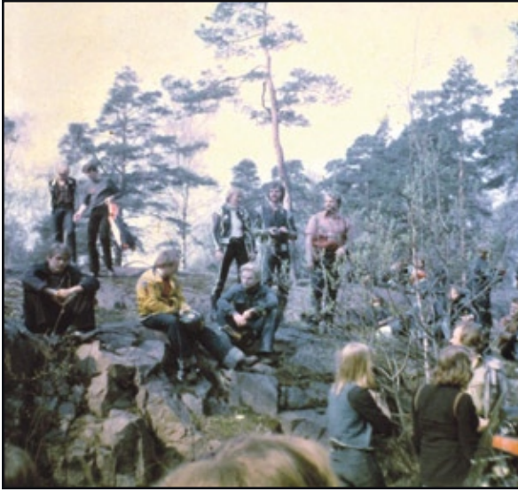
Ylhäällä: Torpan jengä kalliolla 1970-luvun alusta. Melkein kuin Albert Edelfeltin maalauksesta...