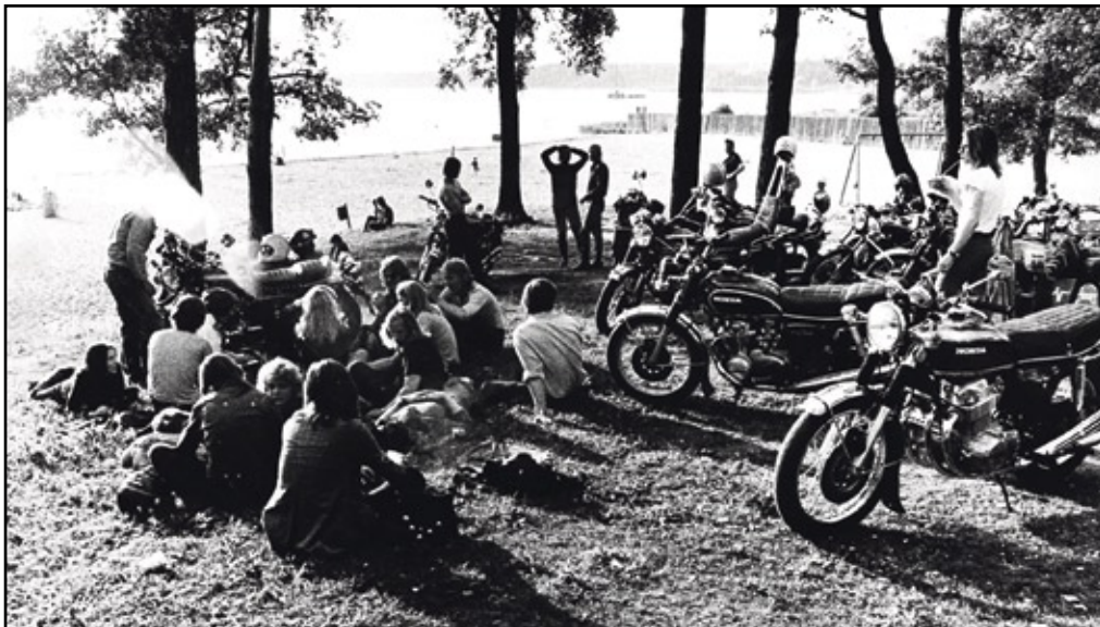
Hietsu oli myös suosittu motoristien kokoontumispaikka ennenkuin kerhotoiminta alkoi.