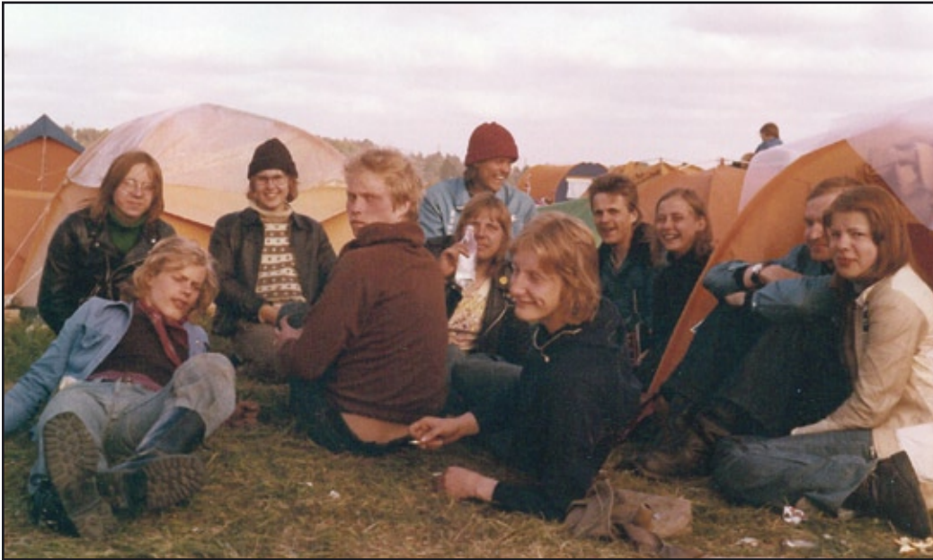
Vapaat tiet, telttailu luonnon helmassa, rock ja samanhenkisten tapaaminen ovat aina kuuluneet yhteen moottoripyöräilyn kanssa. Kokoonumisajojen kultakaudella käytiin isolla joukolla tapahtumissa usein ja kaukanakin.